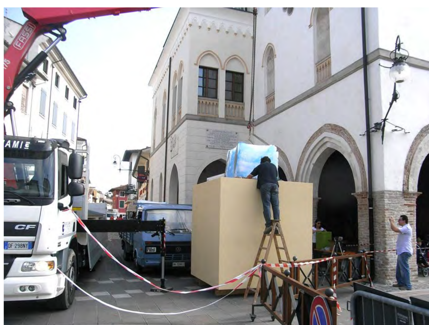
Il primo cubo viene inserito nella casa realizzata dalla Gregoris Legnami su progetto dell'Ing. Pepe