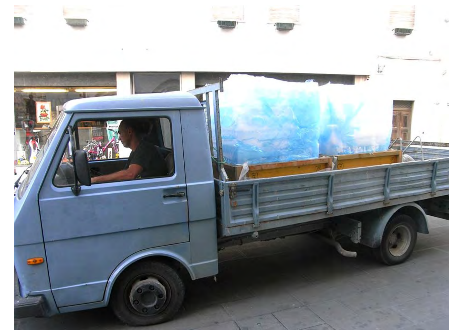
I due cubi di ghiaccio arrivano dalla Bofrost