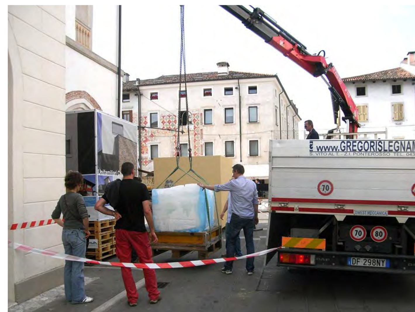
Il secondo cubo viene posizionato all'esterno